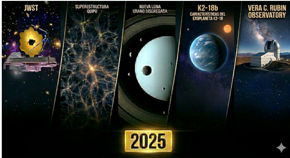
Imagen generada con IA (Gemini)